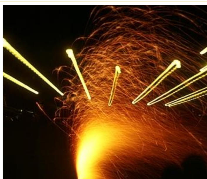
Ein Feuer, das sich brausend verteilt.

Hier ist wieder das Feuer Zeichen für die Gegenwart Gottes, aber wie anders als beim ersten Bund am Sinai! Hier im Neuen Bund ist das Feuer Gottes nichts Erschreckendes, Abstand